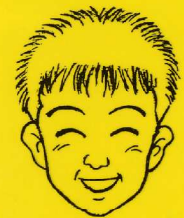
ひろむ ぶんこ 博勇文庫とは

交通事故により 小学2年生でこの世を 去った子供の名前をとり 名付けました この笑顔のように 子供たちが楽しく元気で すごしてほしいと願い 本を寄贈しました 交通ルールを守り 事故にあわないように 気をつけて下さい