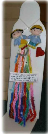
東京丸の内会場の千羽鶴

あれから6年、13回忌も過ぎ、娘も亡くなった息子の歳を超えました。6月に札幌で2回目のメッセージ展をすると聞き、もう一度主人に話してみました。主人は「そろ