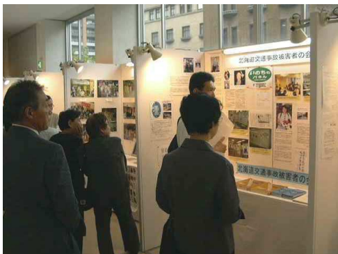
会場ロビーの展示ブースに、被害者の会の活動とパネルを紹介しました

最近、道交法の改正で罰則規定が引き上げられ、また12月には犯罪被害者基本法が成立するなど、被害者の活動が法改正につながっていることは喜ばしいことです。これからも被害者の声に耳を傾けて欲しいと願っています。